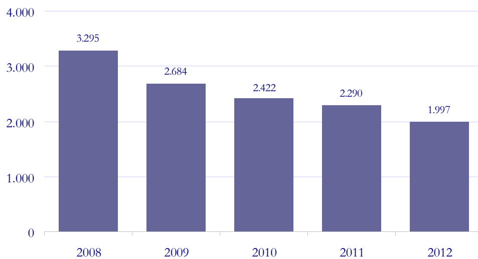
Gráfico 4. Evolución de festejos taurinos celebrados